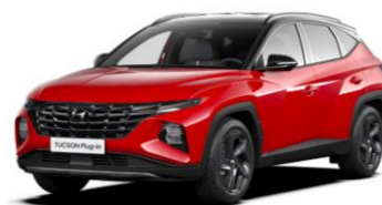
"Engine Red" (JHR) ** "Phantom Black" - juodas stogas