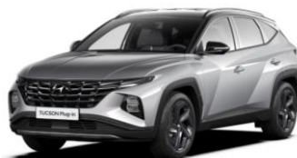
"Shimmering Silver" (R2T) metalizuota