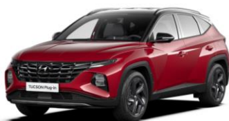
"Sunset Red" - metalizuota "Phantom Black" - juodas stogas (WRT)