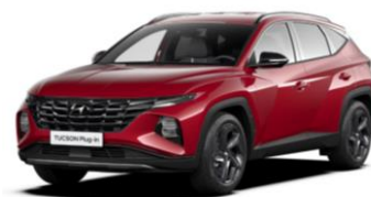
Sunset Red (WR6) Pärlmuttervärv