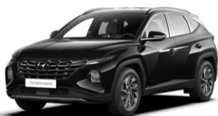
Phantom Black (PAE)