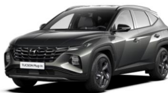
"Amazon Gray" - metalizuota "Phantom Black" - juodas stogas ( A51)