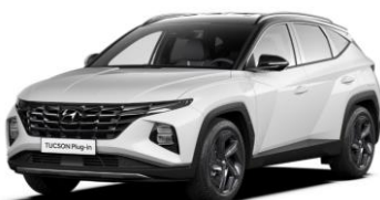
"Serenity White" perlamutrinė "Phantom Black" - juodas stogas (W6E)