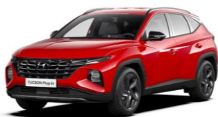
"Engine Red" (JHR)