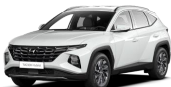
Polar White (PYW)